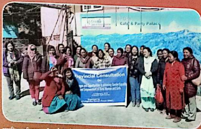
ग्रामीण महिला र किशोरीको आर्थिक सशक्तीकरणका अवसर र चुनौती विषयक कार्यक्रममा सहभागी महिलाहरू