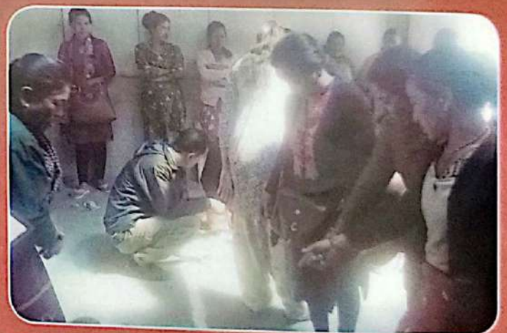
सामाजिक नक्शा बनाउँदै तारेभिर महिला समूहका सदस्यहरू, तारेभिर, काठमाडौं