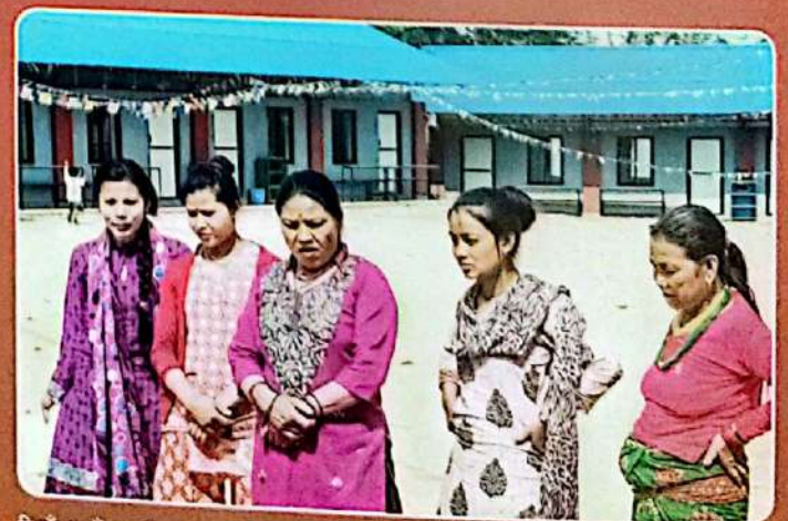
निवुँ गाउँ आदिवासी महिला समूहका सदस्यहरू, सिन्धुपाल्चोक