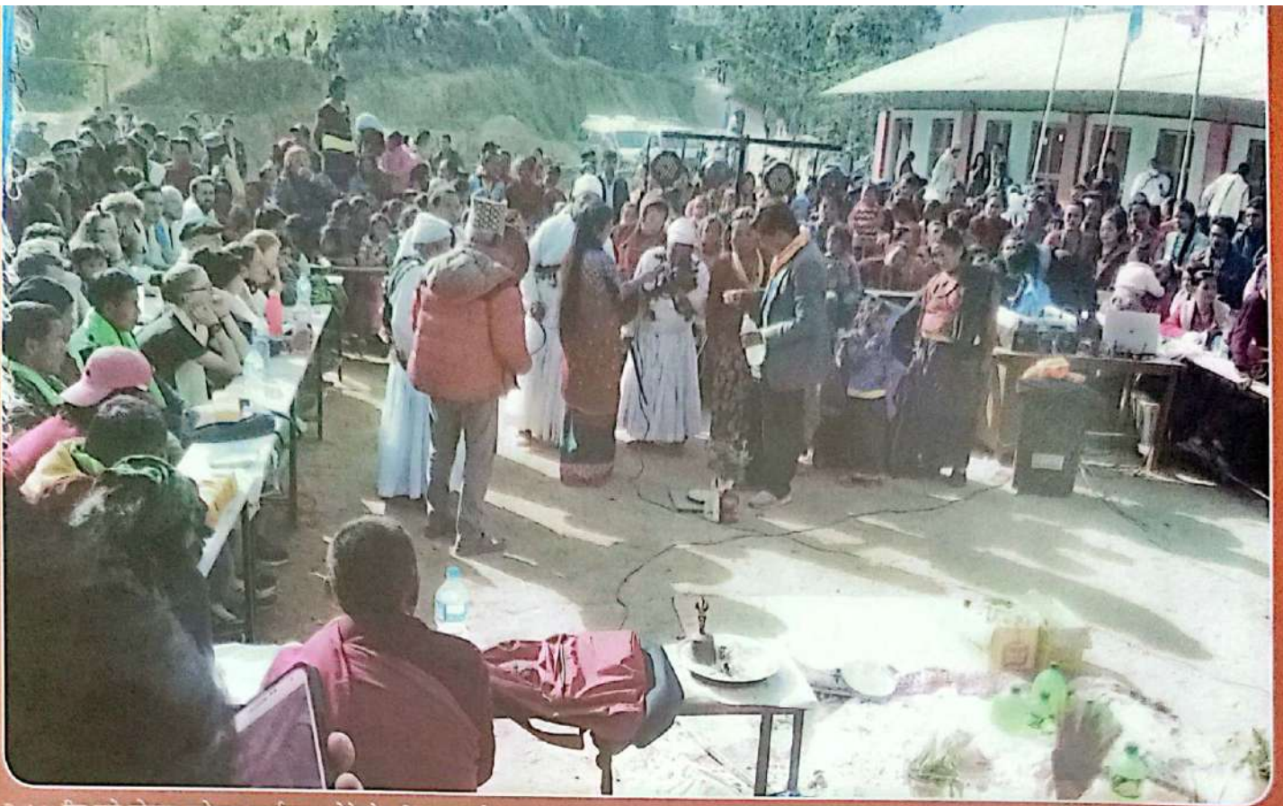
२८५४ खि ल्हो सोनाम ल्होसार कार्यक्रम, भोटेचौर, सिन्धुपाल्चोक